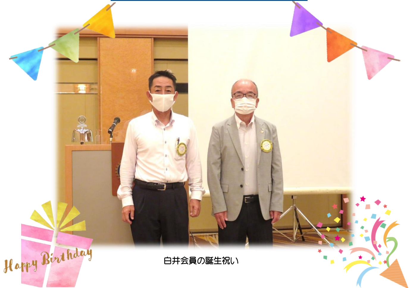
白井会員の誕生祝い