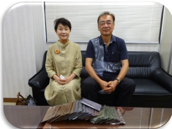
7月6日麗子夫人讃岐学園マスク