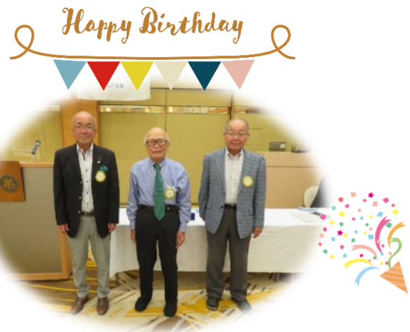
誕生日（植松会員、越智会員）