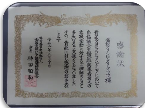
全国骨髓バンク推進連絡協議会 感謝状