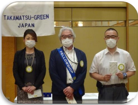
3月 石川・出雲・横井会員