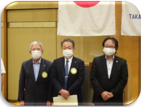
4月 箕・難波・幡・造田・岩村・福島会員