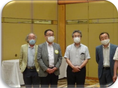
6月関谷・塩田会員